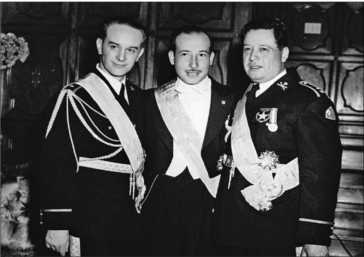
Triunviros: Jacobo Árbenz Guzmán, Jorge Toriello Garrido y Francisco Javier Arana.

¿Qué perseguía la Constituyente al incluir en el texto la regulación sobre el Ejército? RESPUESTA: “El ejército, aún sin una plena conciencia de ello, ha sido una superestructura con frecuencia todopoderosa. Era preferible encausar esa fuerza, acotarla, para que de alguna manera se pusiera al servicio efectivo del país. Se pretendió reducirlo a normas, dignificarlo como institución nacional y ponerle fin al predominio de la fuerza bruta. Ingenualmente olvidamos que a ésta no se le puede reducir mediante el raciocinio y no dejamos en el tinero, sino simplemente ignoramos que, sin un cambio básico de las condiciones socioeconómi-