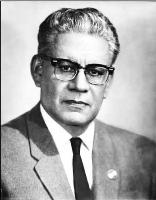
Licenciado Clemente Marroquín Rojas.