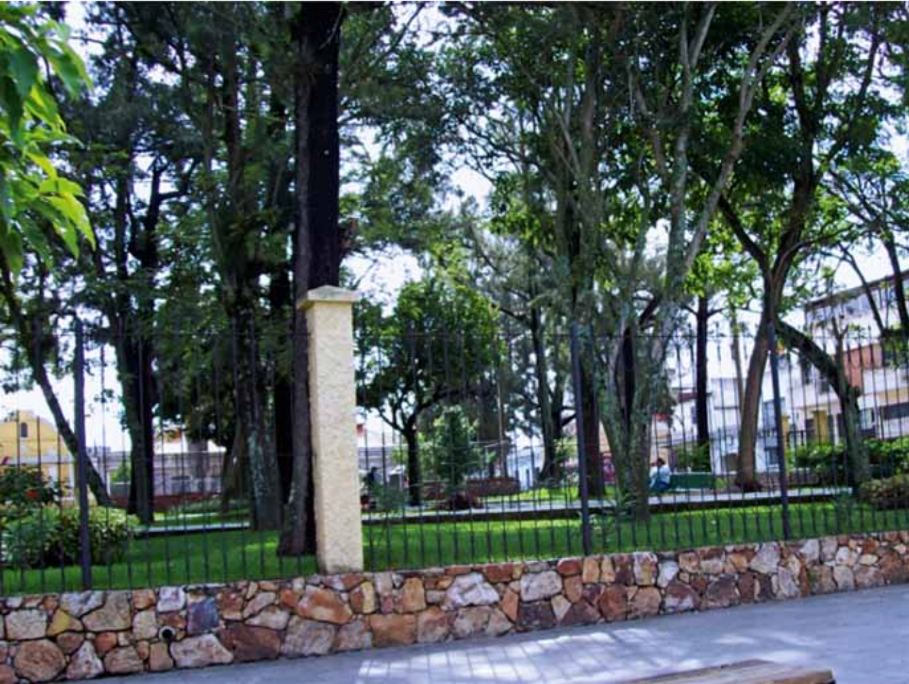
Se le conoció como Alameda de San Sebastián” debido a los árboles de álamo sembrados en sus alrededores; en este lugar acamparon los vecinos de este barrio cuando ocurrieron los terremotos de Santa Marta en los años 1917-1918 y también para el terremoto de 1976. Se dice que en la casa que está al frente del templo, nació el escritor Enrique Gómez Carrillo, quien fue el Cronista de la ciudad, periodista y diplomático de Guatemala en Europa.