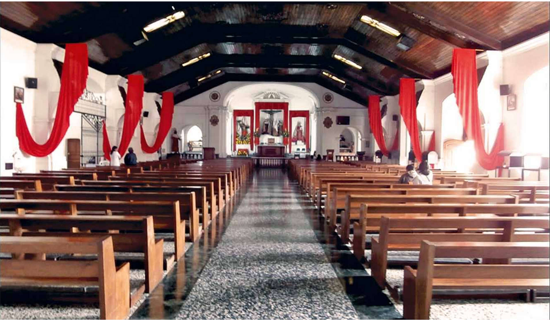
Viene de la página 3.